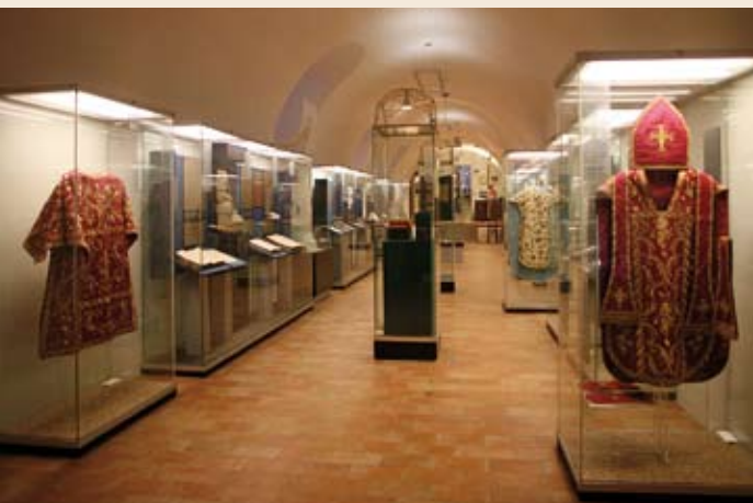
Expozícia Diecézneho múzea na Nitrianskom hrade