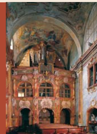
Interiér Katedrály sv. Emeráma