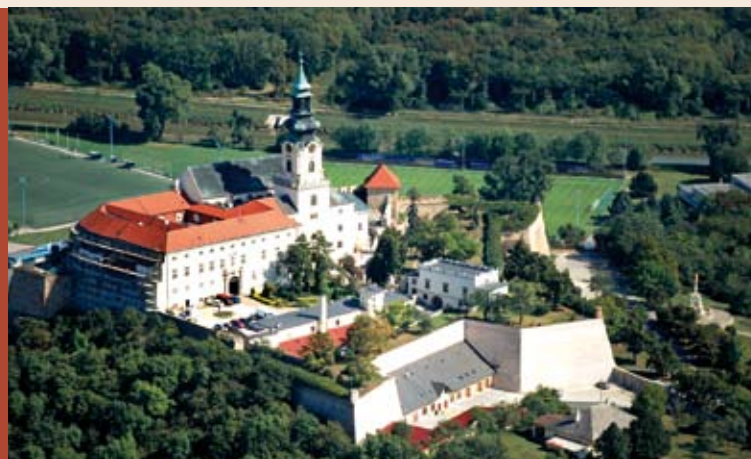
Nitriansky hrad s katedrálou a biskupským palácom