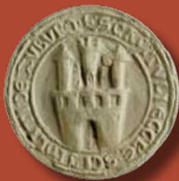
Pečať kapituly Kostola sv. Hypolita