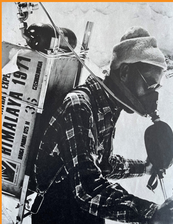
Kyslíkový prístroj sa použil čisto na medicínske účely.

Z prvej úspešnej nemeckej expedície vystúpil na vrchol jediný jej člen, legendárny Rakúšan Hermann Buhl. Do roku 1970 sa uskutočnili ďalšie prvovýstupy na Nanga Parbat, oba si pripísali medzi úspechy nemeckí a rakúski horolezci. Českoslo-