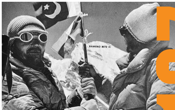
Predvrchol Nanga Parbatu, 11. júla 1971, asi 11.30 h, prvovýstup. V pozadí Rameno a Nanga Parbat.

venské horolezectvo v 50. rokoch minulého storočia nemalo možnosť zapojiť sa do svetových pretekov o dosiahnutie panenských himalájskych osemtisícoviek. Až v roku 1958 sa podarilo otvoriť cestu na sovietsky Kaukaz – v stenách jeho vrcholov získavali slovenskí a českí horolezci úspech za úspechom aj potrebné skúsenosti.