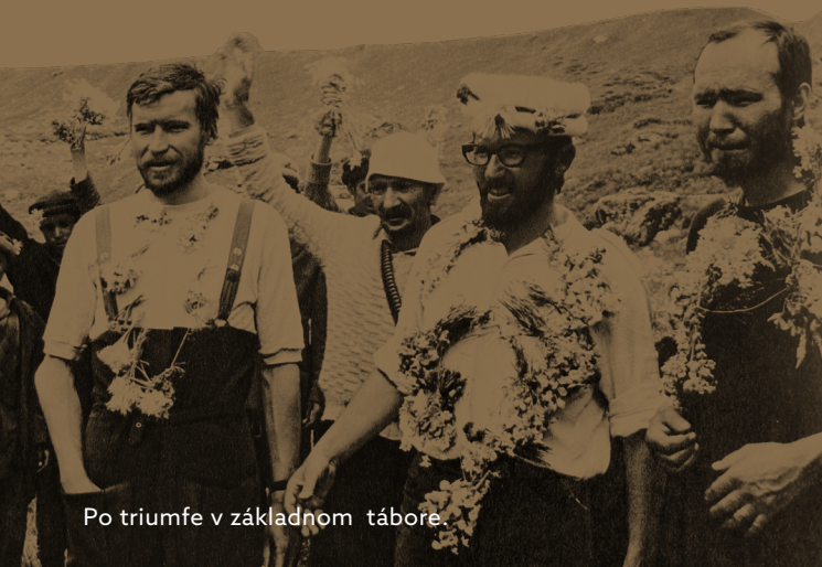
Po triumfe v základnom tábore.