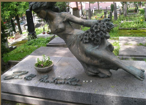
Náhrobok s názvom Múza, historický cintorín v Dolnom Kubíne

Na líci zberateľskej euromince je v rámci vyobrazený Oravský hrad ako symbol životného pôsobenia Janka Matúšku, nad ktorým je štátny znak Slovenskej republiky. Faksimile dobového autentického zápisu textu hymny Slovenskej republiky v štyroch riadkoch je v pravej časti mincového poľa. V spodnej časti je v opise nápis SLOVENSKO a nad ním letopočet 2021. Vľavo od rámika je značka Mincovne Kremnica, štátny podnik, ktorú tvorí skratka MK umiestnená medzi dvoma razidlami.