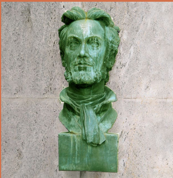
Busta J. Matúšku pred gymnáziom v Dolnom Kubíne

JANKO MATÚŠKA (10. 1. 1821 – 11. 1. 1877) bol slovenský básnik a aktivista. Prežil celý život na rodnej Orave, s výnimkou niekoľkých rokov štúdia na gymnáziu v Gemeri a na evanjelickom lýceu v Prešporke. Práve v tomto krátkom období pôsobenia v podnetnom prostredí spolku študentov okolo Ludovíta Štúra vytvoril svoje skromné literárne dielo. Písal básne, balady na motívy ľudovej tvorby, historizujúce príbehy, pokúsil sa aj o drámu. Študentskými prácami vstúpil do našich dejín nielen ako romantický básnik, ale predovšetkým ako autor textu piesne, ktorá sa neskôr stala štátnou hymnou.