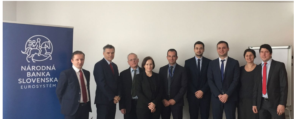
Kolegovia z Národnej banky Srbska a experti NBS počas študijnej návštevy v NBS vo februári 2020

Virtuálna misia v oblasti prania špinavých peňazí pre zamestnancov Národnej banky Republiky Severné Macedónsko a Ministerstva financií Republiky Severné Macedónsko sa konala v rámci EÚ projektu Twinning North Macedonia. Experti NBS prezentovali fungovanie a aktivity v oblasti prania špinavých peňazí v NBS a v Eurosysteme a pri dohľade nad finančným trhom.