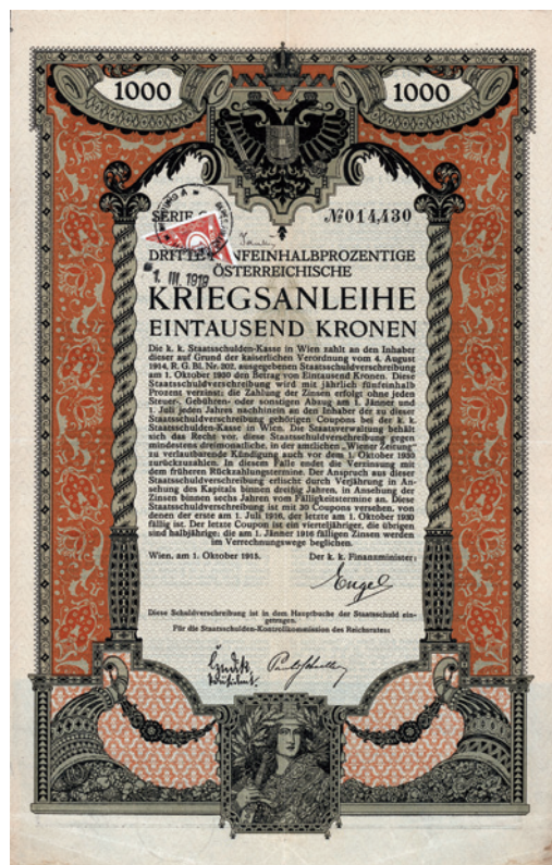
Obligácia tretej rakúskej vojnovnej pôžičky v hodnote 1 000 korún z roku 1915

Upisovanie vojnových pôžičiek predstavovalo istú skúškou dôveryhodnosti bánk (u obyvateľstva i vo vládnucich kruhoch), pričom môžeme pozorovať rozdiely v postojoch slovenských a maďarsko-nemeckých bánk na Slovensku. Slovenské banky sa museli chtiac-nechtiac zapojiť do upisovania, hoci to pre ne znamenalo