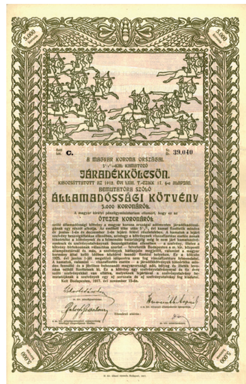
Obligácia siedmej uhorskej vojnovnej pôžičky v hodnote 5 000 korún z roku 1917