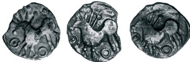
Obr. 3. Keltské mince spišského typu zo Žehry – hradnej výšiny Spišského hradu.