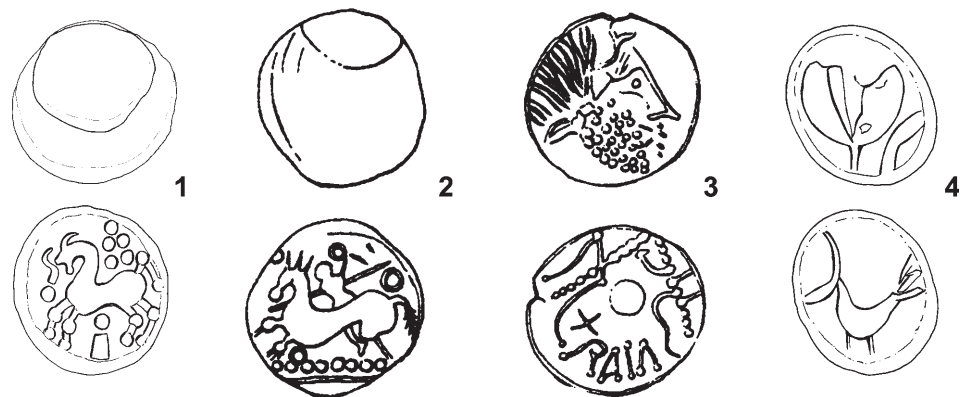
Obr. 5. Keltské mince. 1 – typ Liptovská Mara; 2 – typ Hrabušice; 3 – minca Eraviskov; 4 – typ Zemplín.