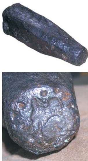
Obr. 6. Keltské razidlo z Folkušovej – celkový pohľad a detail na raziacu plochu s negatívom veľkobystereckého typu keltskej mince.

tátny Spišský hrad (obr. 4). Podobné a navyše aj donedávna neznáme typy keltských mincí sa razili aj na hradisku (resp. v jeho podhradí) Zelená hora pri Hrabušiciach. Spomedzi nálezov sú zaujímavé prvé drachmy spišského typu vyhotovené z bronzu. Pozoruhodné sú však mince typu Hrabušice so špecifickým vyobrazením koňa a jazdom s kopijou na reverze. Tieto mince sa dosiaľ objavili jedine na eponymnej lokalite, a to hneď v štyroch variantoch (obr. 5: 2). Na hrabušickej lokalite sa v neobvykle výraznom počte objavili tiež mince Eraviskov (obr. 5: 3). Predstavovali kmeň, ktorého sídla sa rozprestierali v severovýchodnom cípe maďarského Zadunajska. Výskyt eraviských mincí dokladá obchodné kontakty nositeľov púchovskej kultúry s okolím dnešnej Budapešti, kde v areáli oppida v druhej polovici 1. storočia pred Kr. razili Eraviskovia svoje mince, napodobňujúce námety z rímskych republikánskych denárov. Menej početne sú na Spiši zastúpené drobné keltské mince zemplínskeho typu, ktoré pravdepodobne na hradisku v Zemplíne razilo zmiešané keltsko-dácke obyvateľstvo. Kôň na nich zobrazený pripomína skôr okrídleného vtáka či kohúta. Preto sa prv označovali ako mince s vtáčím koňom (obr. 5: 4).