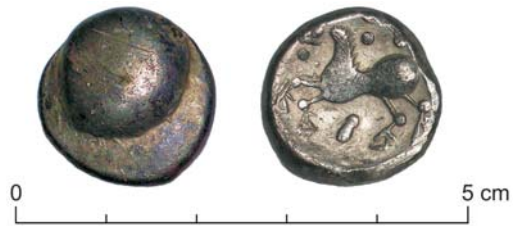
Obr. 2. Najnovší nález (2011) mince veľkobystereckého typu keltskej mince z Jánoviec-Machaloviec.