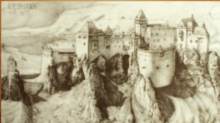
Lietavský hrad v roku 1615

k vybudovaniu kariéry. Ambiciózny Turzo získal roku 1606 grófsky titul a koncom roku 1609 bol zvolený za palatína, ktorý bol najvyššie postaveným svetským hodnostárom v Uhorsku. Funkciu zastával až do svojej smrti. Zomrel 24. decembra 1616 v Bytči.