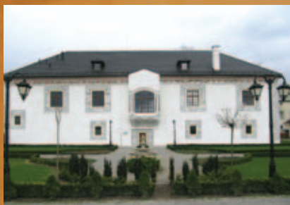
Sobášny palác v Bytči