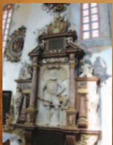
Náhrobná pamiatka Juraja Turza na Oravskom hrade