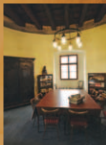
Palatínova knižnica v Bytčianskom zámku