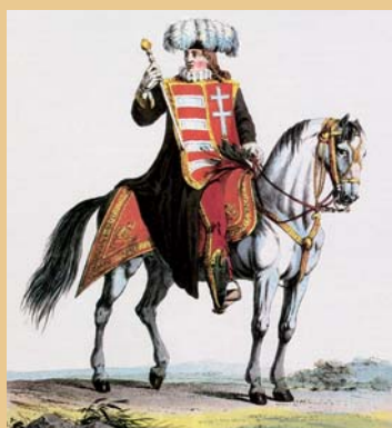
Herold s uhorským znakom

Ferdinand III. zaistil v roku 1646 korunu svojmu prvorodenému synovi Ferdinandovi IV. Ten však napriek korunovácii nikdy nevládol a v roku 1654 zomrel. Kráľ preto zvolal korunovačný snem, ktorý súhlasil