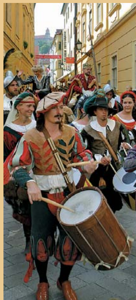
Korunovačné slávnosti v uliciach súčasnej Bratislavy

V Dóme sv. Martina sa v rokoch 1563 – 1830 uskutočnilo devätnásť korunovácií