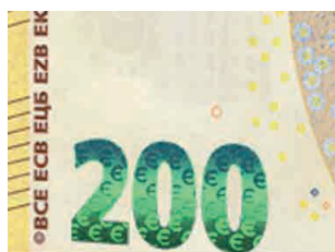
Vylepšené smaragdové číslo na novej 200 € bankovke

farby. Na rubovej strane sa v okienku objavia čísla nominálnej hodnoty dúhovej farby.