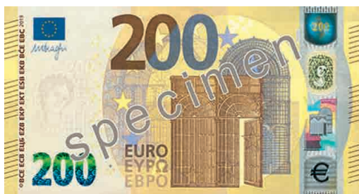
Lícna a rubová strana novej bankovky 200 € série Európa