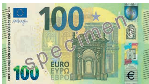
Lícna a rubová strana novej bankovky 100 € série Európa

Nové bankovky 100 € a 200 € prídu spoločne do obehu dňa 28. mája 2019 a budú posledné v rámci druhej série nazvanej Európa, keďže Výkonná rada Európskej centrálnej banky rozhodla, že bankovky nominálnej hodnoty 500 € nebudú začlenené do série Európa. Existujúce bankovky 500 € však naďalej zostávajú zákonným platidlom.