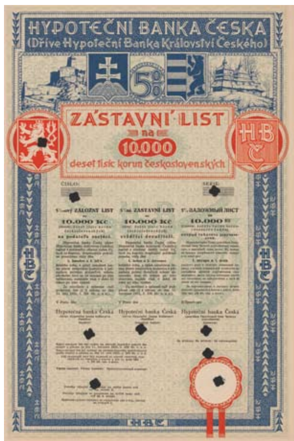
Záložný list Hypotečnej banky českej na 10 000 Kč, v hornej časti s motívmi Slovenska a Podkarpatskej Rusi

Najlacnejší úver poskytovali v Československu peňažné ústavy zaoberajúce sa sprostredkovaním úveru bez zisku – zemské. Tento typ peňažných ústavov na Slovensku dovedy neexistoval, ale v Čechách už mali dlhú a úspešnú históriu Zemská banka, Praha, a Hypotečná banka česká, Praha. V roku 1924 rozšírili svoju pôsobnosť na Slovensko a Podkarpatskú Rus vytvorením filiálok v Bratislave. Zemská banka neskôr v roku 1937 otvorila aj filiálku v Užhorode a Hypotečná banka česká v roku 1926 expositúru v Košiciach. Na obe filiálky sa vzťahoval zákon číslo 238/1922 Zb. z 11. júla 1922, ktorý umožnil ich vznik. Československý štát poskytol Zemskej banke i Hypotečnej banke českej po 16 miliónov Kč ako prevádzkový kapitál pre ich bratislavské filiálky. Hlavným zameraním Zemskej banky na Slovensku bolo poskytovať pôžičky krajine, okresom, obciam a iným verejnoprávnym korporáciám, ktoré boli oprávnené vyberať prirážky na úhradu svojich potrieb. Zemská banka teda poskytovala hlavne komunálny úver, ďalej povoľovala pôžičky na melioračné (jednotlivcom alebo skupinám, vodným družstvám) a železničné účely a na základe všetkých týchto úverov vydávala vlastné dlhopisy a záložné listy, ktoré mali status už spomínanej pupilárnej istoty. Hypotečná banka česká sa mala zaoberať predovšetkým poskytovaním hypotekárnych úverov na pozemky a domový majetok. V čase zriadenia filiálky poskytovala v českých krajinách pôžičky na 4 % úrok a vydávala aj 4 % záložné lis-