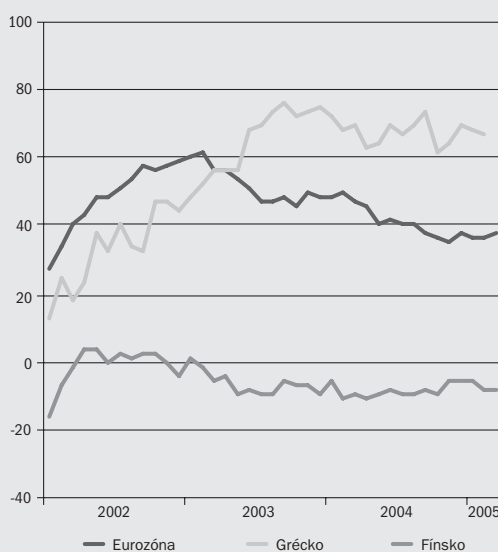
Graf 2 Vnímaná inflácia: Fínsko a Grécko

Fenomén vnímanej inflácie je preto žiaduce systematicky sledovať, analyzovať a celú problematiku jasne komunikovať verejnosti – s osobitným zreteľom na vybrané skupiny spotrebiteľov (napr. dôchodcovia).