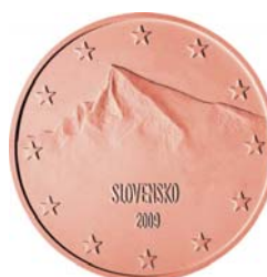
2 centy Kriváň