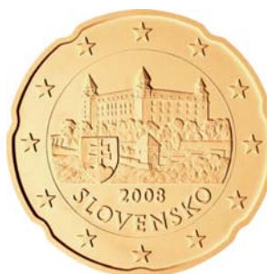
20 centov Bratislavský hrad