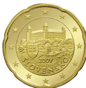
20 eurocentov Bratislavský hrad