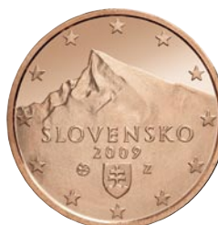
2 eurocenty Kriváň