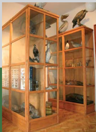
Expozícia múzea A. Kmeťa