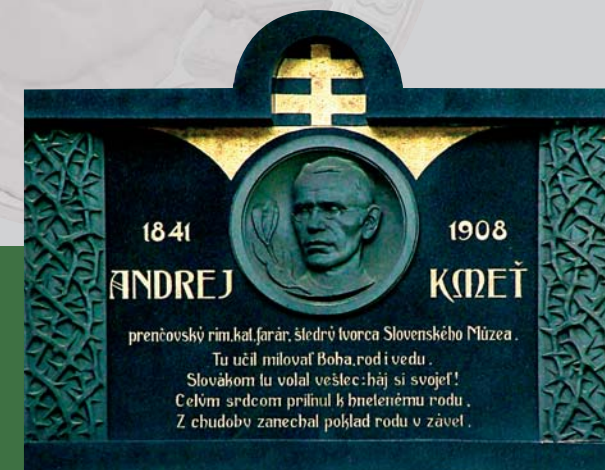
Pamättná tabuľa na fare v Prenčove