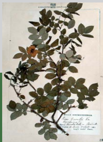
Ukážka z herbára