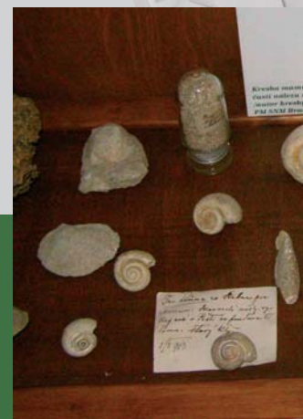
Exponáty z geologickej zbierky