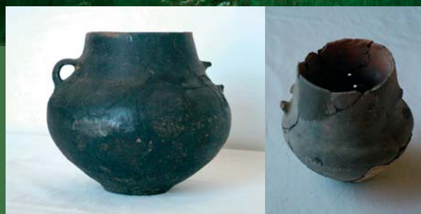
Archeologické vykopávky z Beše

Na rube mince je v strede mincového poľa zobrazený portrét Andreja Kmeťa, v pravej časti doplnený fragmentmi predmetov z jeho zberateľskej činnosti. Pri ľavom okraji je meno a priezvisko ANDREJ KMEŤ a pri pravom okraji letopočty jeho narodenia a úmrtia 1841 – 1908 .