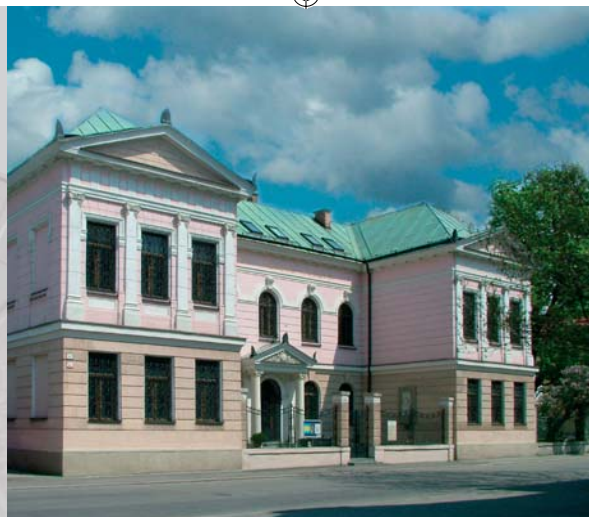
Múzeum Andreja Kmeťa v Martine

Andrejovi Kmeťovi patrí popredné miesto ako zakladateľovi Slovenského národného múzea, ako aj myšlienkovému tvorcovi a iniciátorovi založenia Muzeálnej slovenskej spoločnosti (1893), ktorej hlavným programom bola záchrana pamiatok národnej minulosti. Ako prvý a doživotný predseda spoločnosti naplňal jej vlastivedný zberateľsko-muzeálny program. Jeho rozsiahle zbierky archeológie, ľudovej kultúry, histórie, živej aj neživej prírody sa stali základom zbierok prvého národného múzea Slovákov. Jeho zásluhou boli položené v Turčianskom Sv. Martine základy prvej účelovej budovy Slovenského