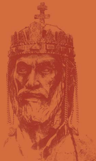
Mojmír II. vo výtvarnom stvárnení akad. soch. V. Matušinca